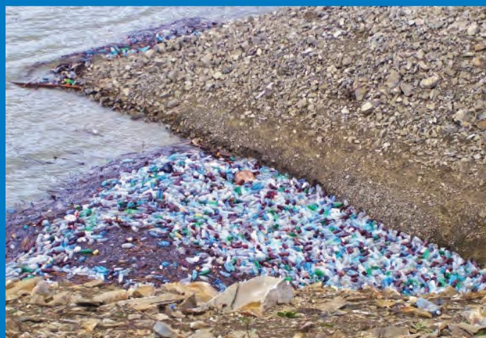
LOCUL 3 LITTER LESS, Categoria Fotografie / 11-14 ani: A Corner Of Pollution On Lake Bicz, Autor: Ruxandra Florea, Școala Gimnazială „Mihai Eminescu”, Roman, Județul Neamț, Prof. Emilia Ciomârțan.